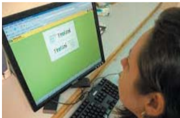
PROUNI – 1 O resultado da segunda chamada do ProUni será divulgado no dia 19 no portal siteprouni.mec.gov.br.