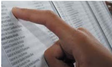
PROUNI – 2 Candidatos que não forem selecionados poderão participar da lista de espera nos dias 2 e 3 de março. Programa oferece bolsas em faculdades particulares.