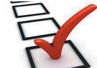
TRICAMPEÃO – 2 A pesquisa mostra ainda maior popularidade do ex-presidente Lula entre os jovens, com 64%; e entre os mais pobres, com 61%.