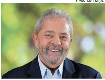
TRICAMPEÃO – 1 Com 56% dos votos, Lula foi eleito, pela terceira vez, o melhor presidente da história do Brasil, segundo pesquisa Datafolha.