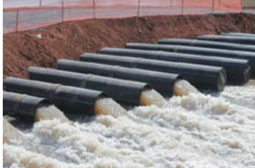
CRISE HÍDRICA – 1 Sabesp analisa existência de novo volume morto no Cantareira. Governo não sabe quantos litros há nesta quarta cota do volume morto.