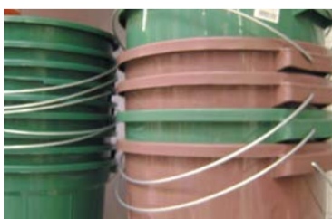
CRISE HÍDRICA – 2 Com a escassez de água em São Paulo, a procura por baldes fez com que o produto ficasse raro e lojistas estão distribuindo senhas para atender os clientes.